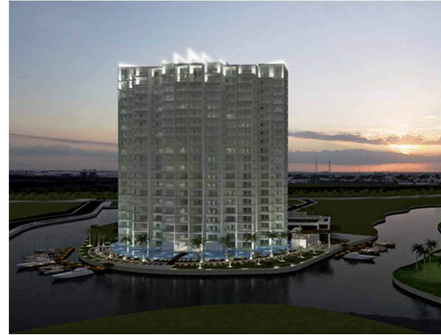
Maioris Tower Puerto Cancún, México

OFICINA COMERCIAL CANCÚN Avda. Bonampak 4-1, Sección E, Manzana 1, Local 1 Edificio Bonampak 4-5, planta baja 77500 Cancún | Quintana Roo | México T (0052) 998 887 43 00 | F (0052) 998 887 43 07